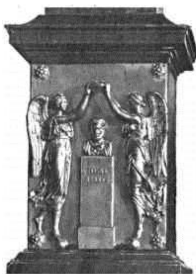
Плита на обелиске с барельефным портретом Минина (И.П. Мартос)