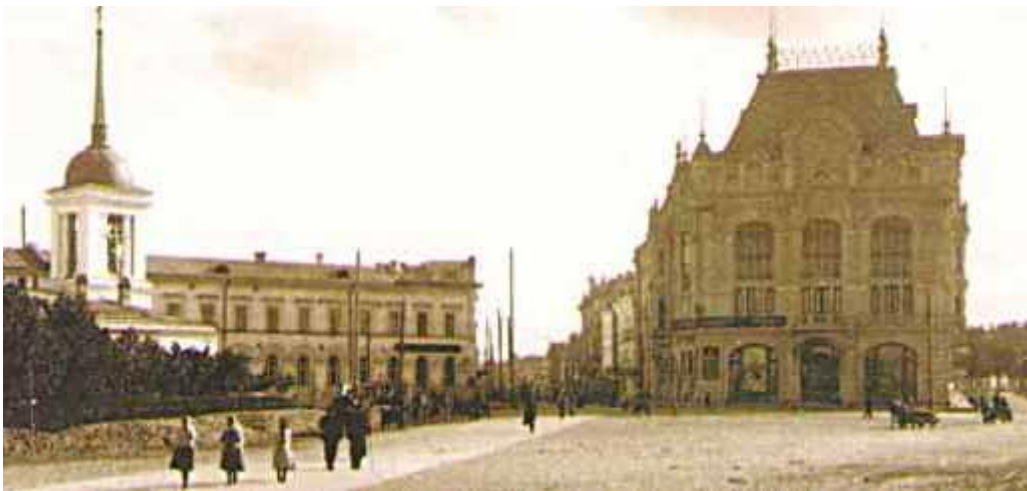
Здание Городской думы (В.П. Цейдлер)

В общей системе стилизовались фасады под "Древнюю Русь". В 1903- 1904 гг. под надзором архитектора Н.М. Вешнякова велась отделка интерьеров. Если говорить об эпохе начала XX в. интерьеры здания остаются в художественном отношении наиболее ценными. Своими формами здание связывает архитектуру Кремля с разностилевой застройкой прилегающих районов города.