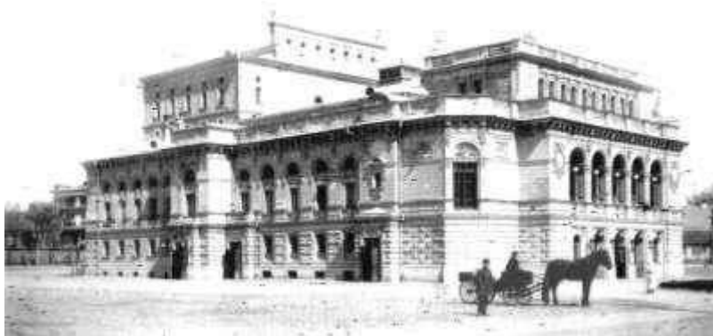
Нижегородский академический театр драмы (В.А. Шретер)

Важным толчком в развитии всех сторон нижегородской культуры стала подготовка и проведение в Нижнем Новгороде Всероссийской промышленно-художественной выставки 1896 года: было построено здание городского театра на ул.Большой Покровской.