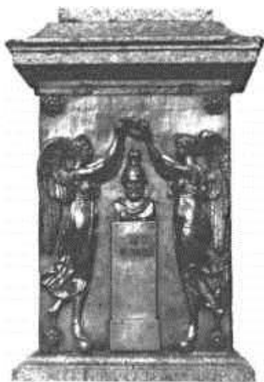
Плита на обелиске с барельефным портретом Пожарского (И.П. Мартос)

История сохранила воззвание патриота Козьмы Минина к нижегородскому люду: “О, братие и друзи, вси нижегородский народы! Что сотворим ныне, видяще Московское государство в велицем разорении? Призовем себе в Нижнем Нове граде храбрых и мужественных воин Московскаго государства, достоверных дворян града Смоленска, ныне бо они близь града нашего, в арзамастех местех”. Нижегородцы единодушно поддержали призыв. Самопожертвованием и ратным подвигом нижегородского ополчения Россия была освобождена от иностранных интервентов.