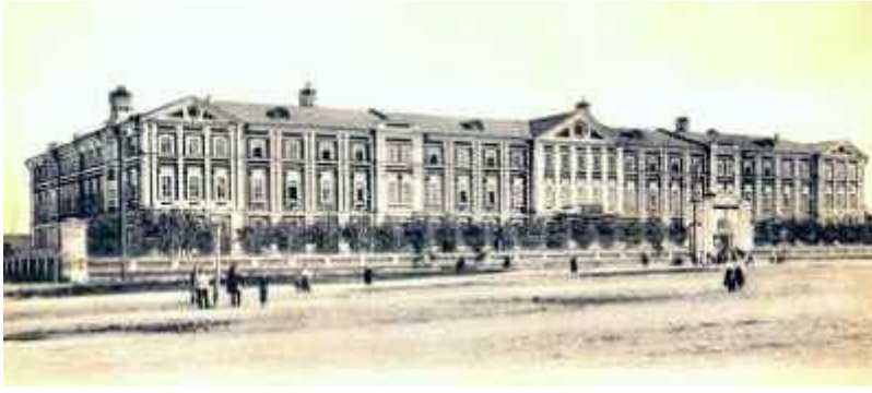
"Вдовый дом" (Н.А. Фредлих)

В 1897 г. Дума решила возвести на Благовещенской площади (пл.Минина) административное здание.